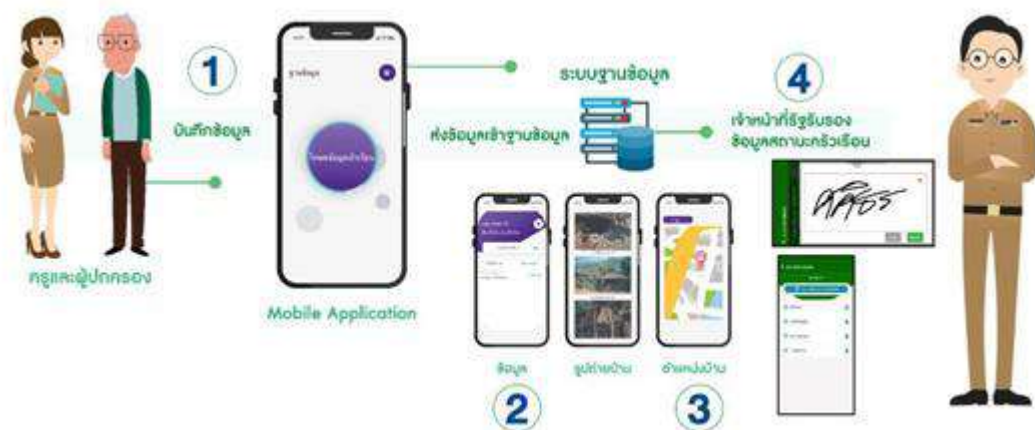
แผนภาพที่ 1 ขั้นตอนการคัดกรองนักเรียนทุนเสมอภาค

หมายเหตุ : กรณีที่พิกาศัยของนักเรียนอยู่ต่างจังหวัด/ต่างประเทศ หรือไม่ได้รับอนุญาตให้ถ่ายภาพ อนุโลมให้ถ่ายภาพนักเรียนคู่กับป้ายชื่อสถานศึกษา